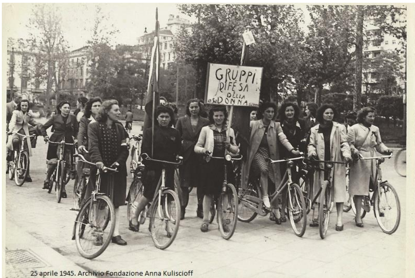
25 aprile 1945.

RIBELLATEVI! NE AVETE L'ETÀ. STUDIATE, PENSATE, CHIEDETE CONSIGLIO A ME, INVENTATE QUALCOSA PER SORTIRE DA QUESTA TRISTE SITUAZIONE IN CUI SIETE E POTER ARRIVARE AL PUNTO DI FARE REALMENTE, CON UNA LIBERA SCELTA VOSTRA, LE COSE CHE VI PAR GIUSTO FARE.